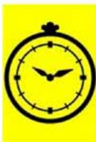
Tijdcontrole (TC) Tijdwisselcontrole (TWC)