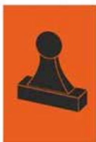
Zelfstempelaar (RC) Bemande (RC)