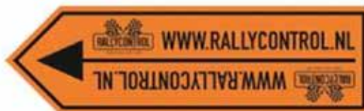
Dwangpijl (routerichting of omleiding)